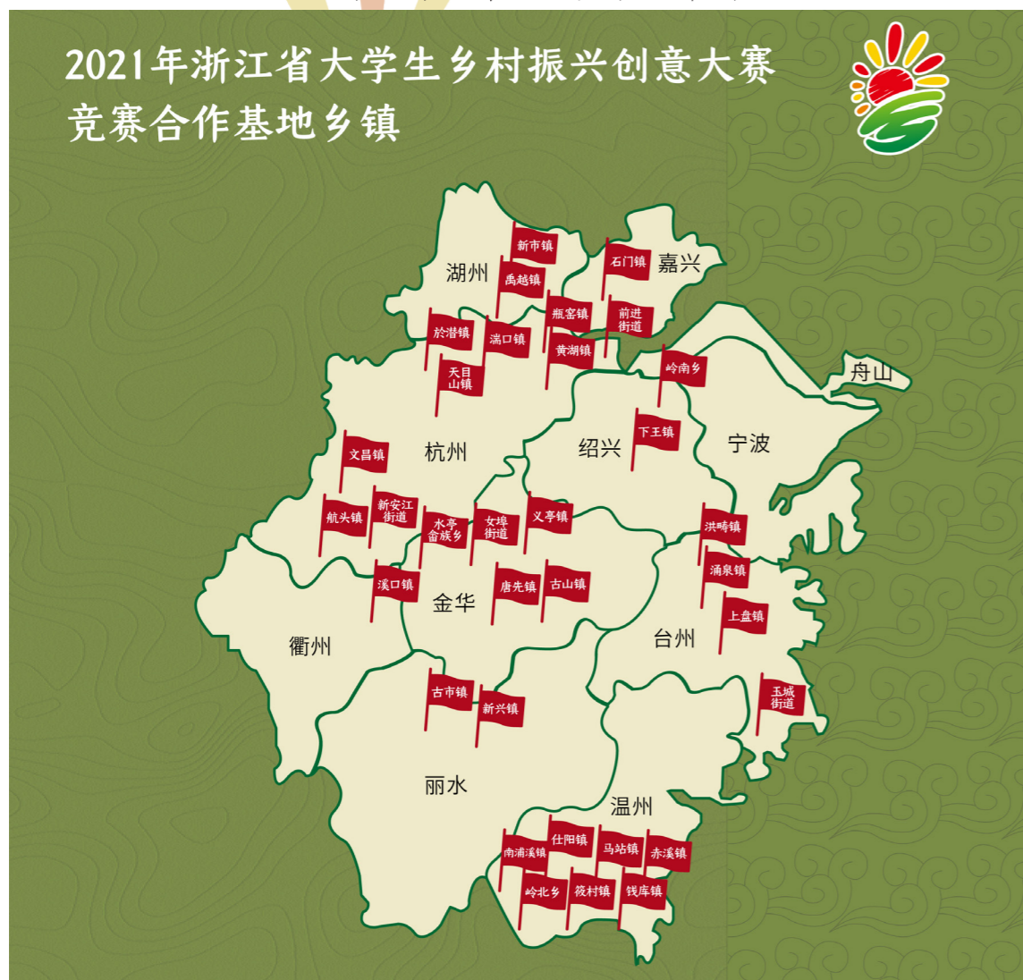
大赛竞赛合作基地乡镇分布图